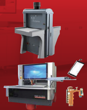
AOI 검사 & 3D 측정 에칭회로 검사 장비