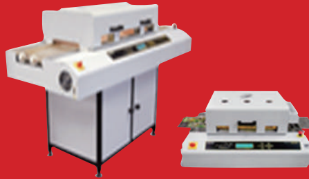
다 품종 소량 생산 Pb-free Reflow Oven