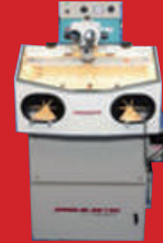
CCR-CWC & WorkCell 디캡, 마킹, 커팅 & 코팅제거 장비