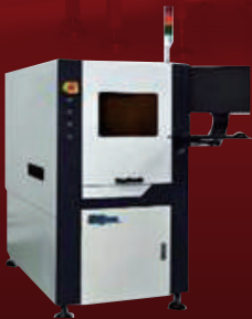
PCB, FPC, SMT & Package Laser Marking

자동차, 방산, 철도, 항공, 우주, 전기, 5G 통신, 전력 반도체 Package