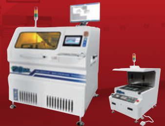
다 품종 소량 생산 Selective & Deeping Soldering

자동차, 방산, 철도, 항공, 우주, 전기, 5G 통신, 전력 반도체 Package