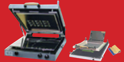
다 품종 소량 생산 Screen & Stencil Printer