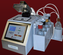
JetEtch & Plasma IC & Package 디캡 장비