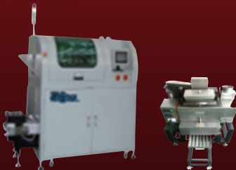
자동 & 반 자동 페 납 재생 장비