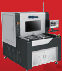
PCB, FPC, SMT & Package Laser Cutting