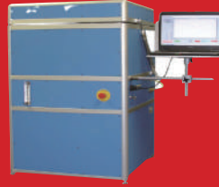
SMD 리플로우 시뮬레이터 SMD Reflow Simulation 젖음성 측정, 열 응력 측정 10종의 리플로우 테스트 등