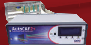
Auto AIR2+ & CAF2+ Ion Migration 측정