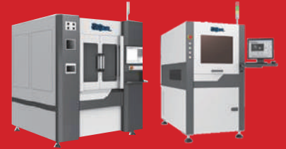
Laser Marking & Cutting 장비