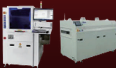
Conformal Coating & Curing 장비