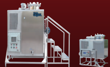
자동 & 반 자동 페 솔벤트 재생 장비