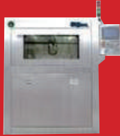
PBT-700S & 800P 솔더링 Pallet, Durostone & Jig 수 세정