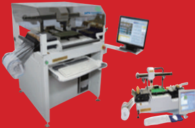
다 품종 소량 생산 Pick & Place System