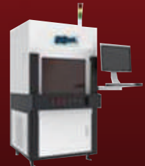
Nano Second Metal NANO Laser Welding