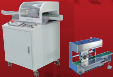
PCB, LED & SMT V-Cutting System