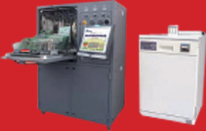
친 환경 PCB & Package 수 세정