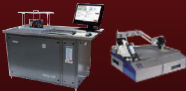
PCB Package 이온 오염도 & 세정정도 측정