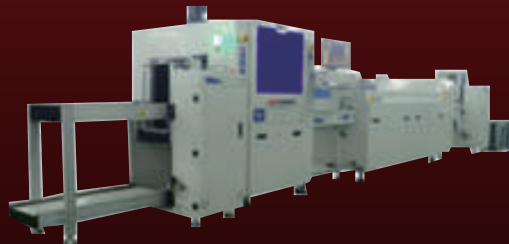
인라인 컨포멀 코팅 장비 로더 - 컨포멀 코팅 - UV 검사 - IR 경화(UV 경화) - PCB 반전 - 컨포멀 코팅 - UV 검사 - IR & UV 경화 - 언 로더