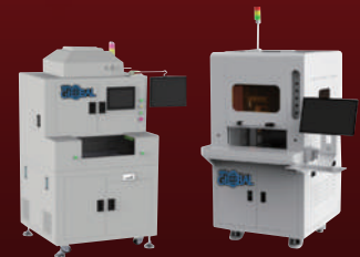
Laser Soldering 장비 Solder ball, Solder Wire & Cream