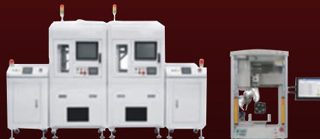
자동 & 반 자동 Robot Soldering System