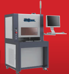
PCB, FPC, SMT & Package Solder Ball, Wire & Cream Laser Soldering