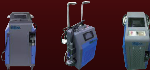
Laser Cleaning System 50W, 100W, 200W, 500W Laser Welding System 1KW & 1.5KW