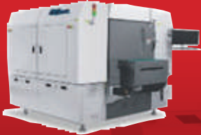
APC-VO 102 수직 적층 경화 오븐