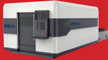
Metal & Non-Metal Fiber Laser High Power Cutting