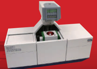
MUST 3 System Solderability 측정

자동차, 방산, 철도, 항공, 우주, 전기, 5G 통신, 전력 반도체 Package