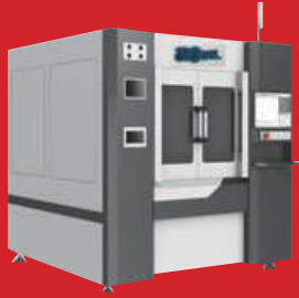
Ceramic, Glass & Sapphire PICO Laser Cutting