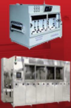
친 환경 BGA & Flipchip 수 세정